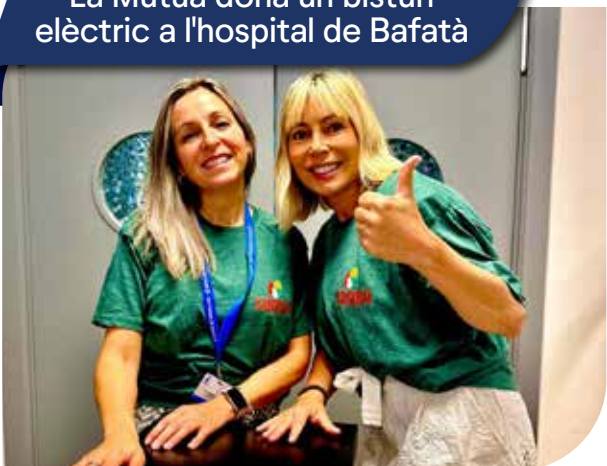
La MÚtua dona un bistrú elèctric a l'hospital de Bafatà