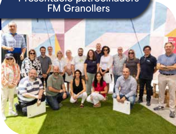
Presentació patrocinadors FM Granollers