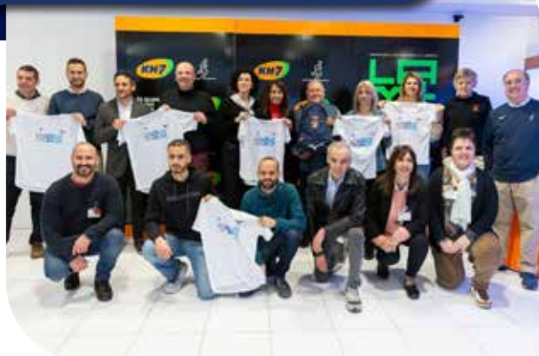
Presentació de la Mitja Marató de Granollers