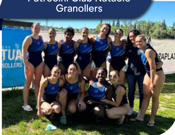
Patrocini Club Natació Granollers