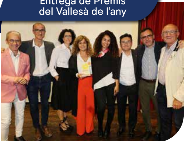
Entrega de Premis del Vallesà de l'any