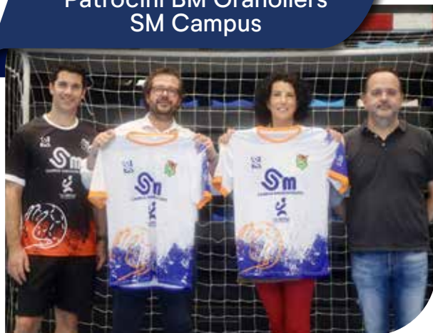
Patrocini BM Granollers SM Campus