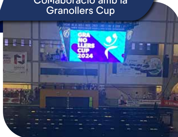
Col·laboració amb la Granollers Cup