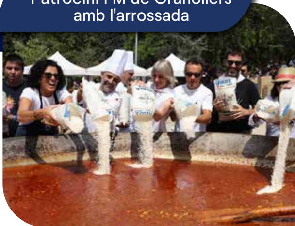
Patrocini FM de Granollers amb l'arrossada